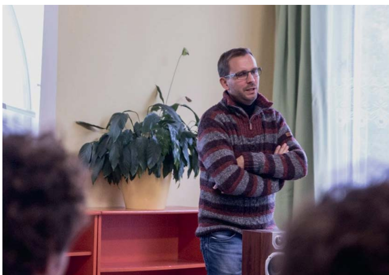
7. Školení prvních ročníků Ústavu hudební vědy FF MU, Křižanov 2018